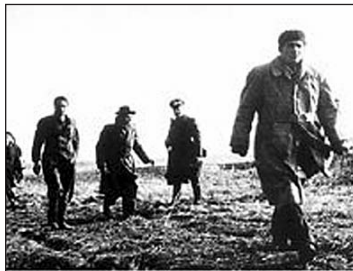
200 ezren hagyták el Magyarországot

Beszéde végén beismerte, hogy a párt elkövetett súlyos hibákat