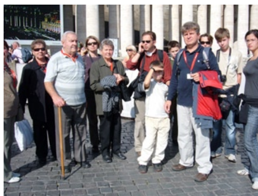
Csoportunk a Római zarándoklaton, Szent Péter terén

Isten áldása és gondviselő szeretete legyen családjainkkal,